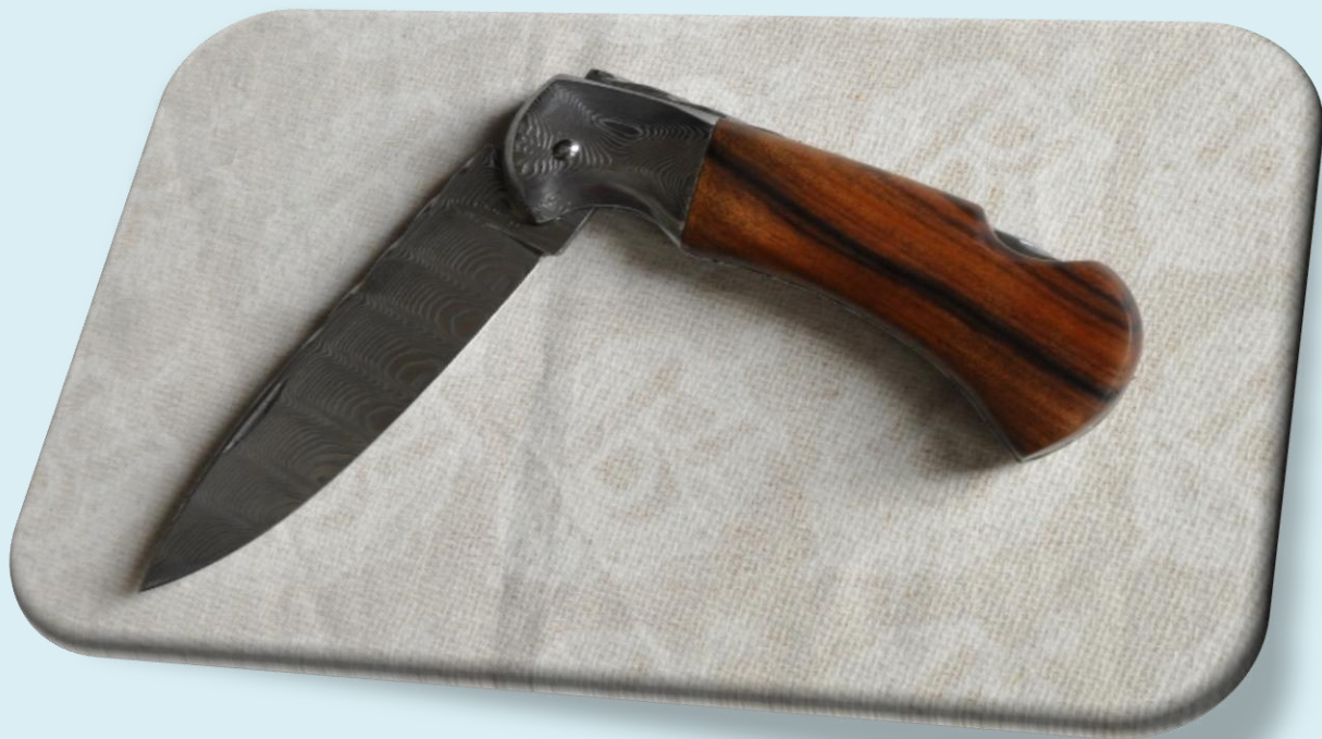
Mikov s.r.o. – zavírací nůž