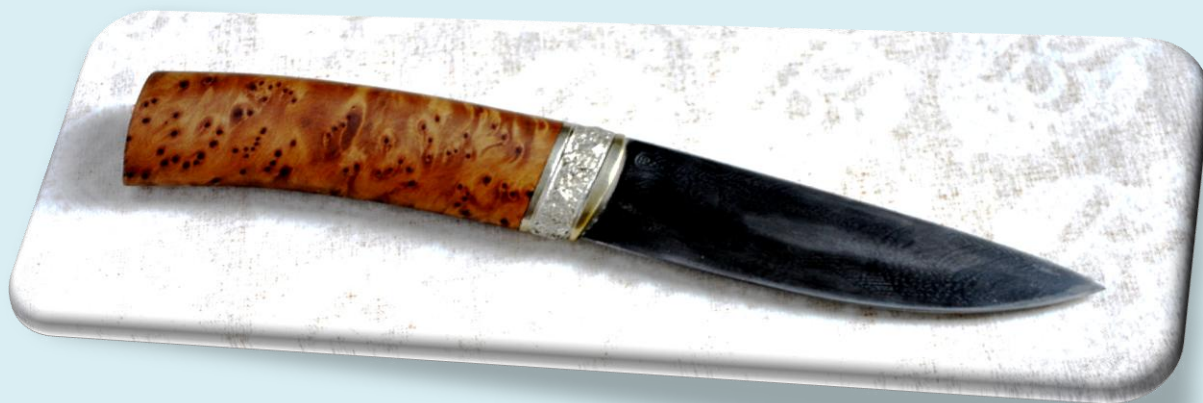
Petr Hrubý – lovecký nůž