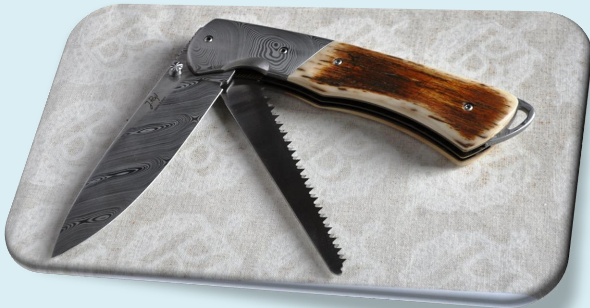
Josef Pajl – zavírací nůž